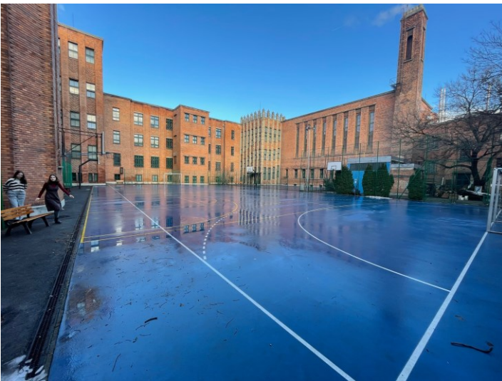
Liikuntatunneilla pelataan oppilaiden mukaan usein jalkapalloa koulun sisäpihan kentällä sään salliessa.