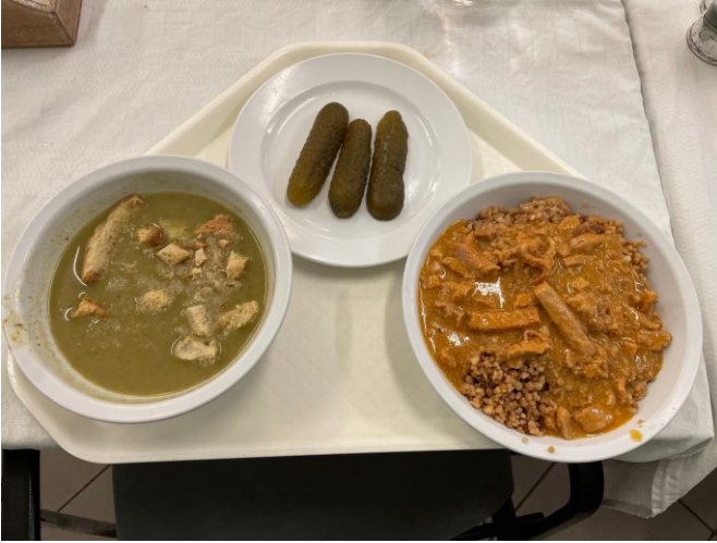
Kouluruokaan kuului aina keitto alkuruoaksi. Ruoka oli maksullista ja useat oppilaat söivät omia eväitään.