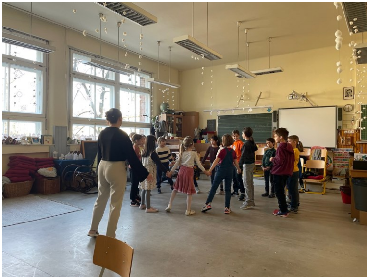
Joulujuhlaan harjoittelua kansantanssin ja laulun merkeissä (2. luokka)