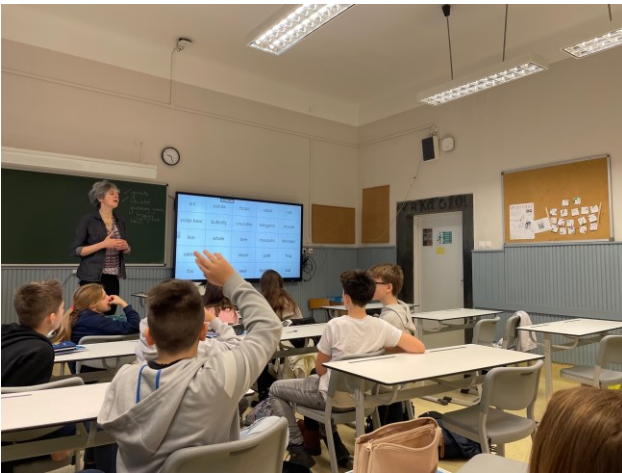
Oppitunneilla oli usein toiminnallisia menetelmiä ja älytaulut olivat opettajien apuvälineinä.