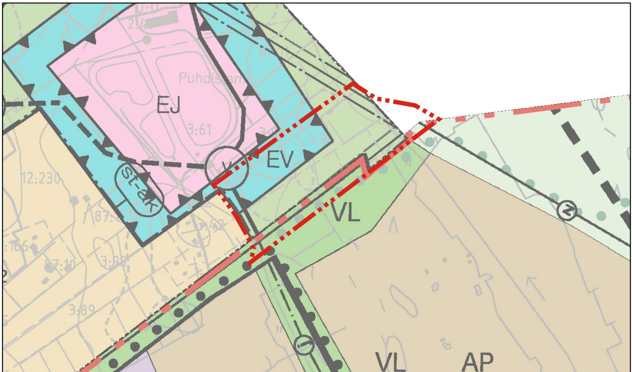
Kuva 2. Ote osayleiskaavasta.

Suunnittelualan pohjois- ja kaakkoisosissa on sähkölinjalle varattu alue, jonka lisäksi Tuomettarenkadun yhteyteen on osoitettu aluevaraus vesijohdon runkolinjalle sekä siirtoviemäriille. Suunnittelualan kaakkoisosassa sijaitsevan sähkölinjan viereen on osoitettu ohjeellinen ulkoilureitti.