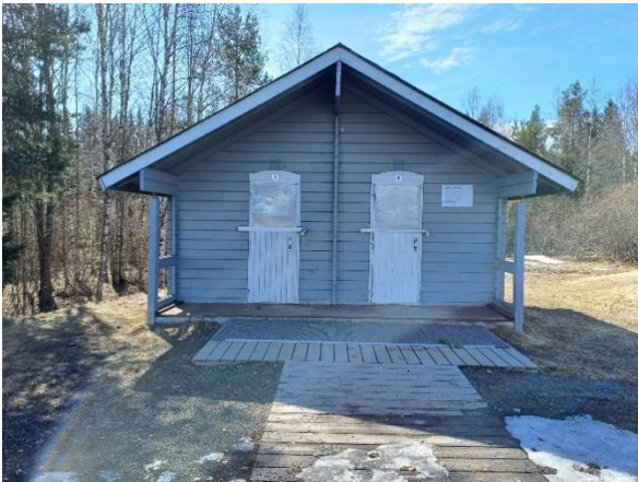
Kuva 3. WC-rakennus