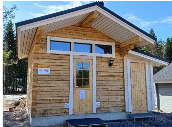
Kuva 4. Talvikäytössä oleva sauna.