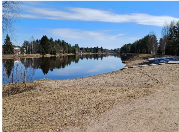
Kuva 2. Näkymä uimarannalta yläjuoksulle.