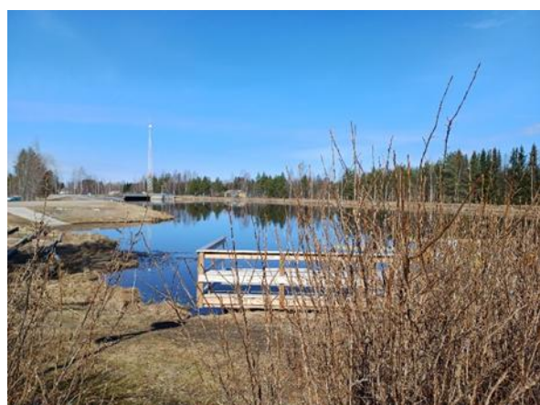
Kuva 6. Hamarin voimalapato sijaitsee rannan välittömässä läheisyydessä.