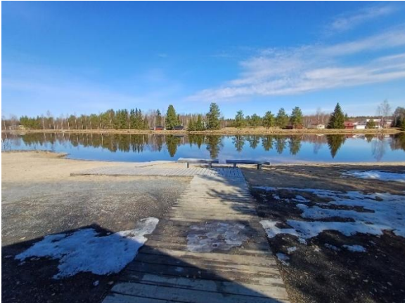
Kuva 1. Hamarin uimaranta